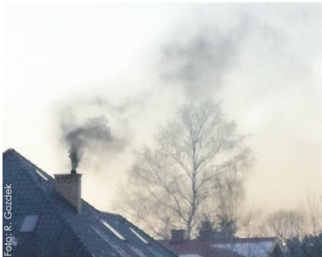
Takie widoki bezwzględnie powinny zniknąć z naszego krajo- brazu.

Do podjęcia tak szybkich kroków skłania sytuacja, z jaką mamy do czynienia tej zimy. Niemal codziennie wydawane są ostrzeżenia o przekroczeniu dopuszczalnych norm zanieczyszczenia powietrza. Wydawałoby się, że powiatu gliwickiego, leżącego wśród pól i lasów, powinno to nie dotyczyć. Jednak tak nie jest. Nasz powiat należy do części północnej i środkowej strefy śląskiej, gdzie – wedle opracowań – podstawowymi źródłami zanieczyszczeń powietrza jest emisja komunalno-bytowa z zabudowy mieszkaniowej, transport drogowy oraz przemysł, m.in. na terenie