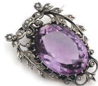
Brosza z ametystem (ze zbiorów Muzeum w Gliwicach).