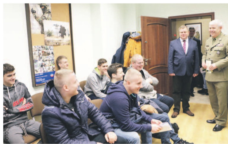
Pierwszego dnia w WKU stawili się młodzi mężczyźni mieszkający w Knurowie.

- Celem kwalifikacji jest nadanie odpowiedniej kategorii zdrowia, która decyduje o przydatności dla armii stawiających się mężczyzn i kobiet. Po jej określeniu i wykonaniu niezbędnych