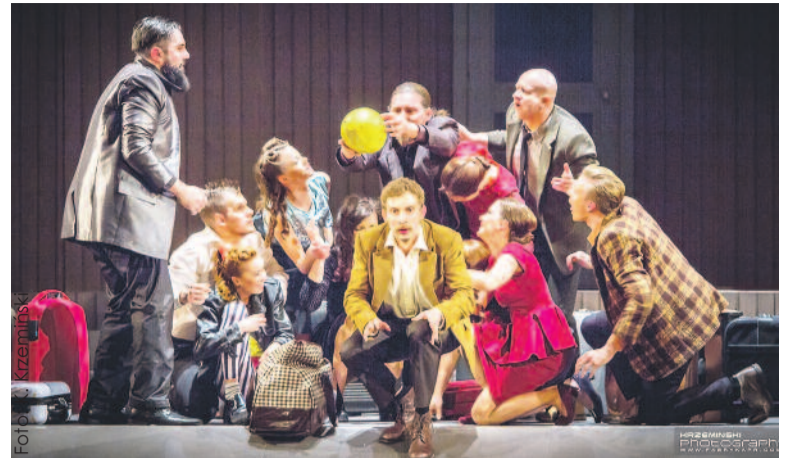
„Dom spokojnej młodości” jest żywiłowy i porywający – głównie za sprawą świetnej muzyki i ekspresji młodych aktorów.