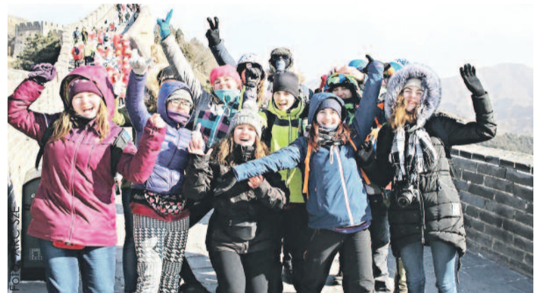
Tak cieszyli się uczestnicy XII Szkolnej Ekspedycji ze zdobycia Chińskiego Muru.