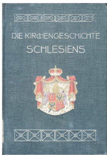
Okladka „Die Kirchengeschichte Schlesiens“ (Historia Kościoła na Śląsku), wydanej we Wrocławiu w 1908 r.