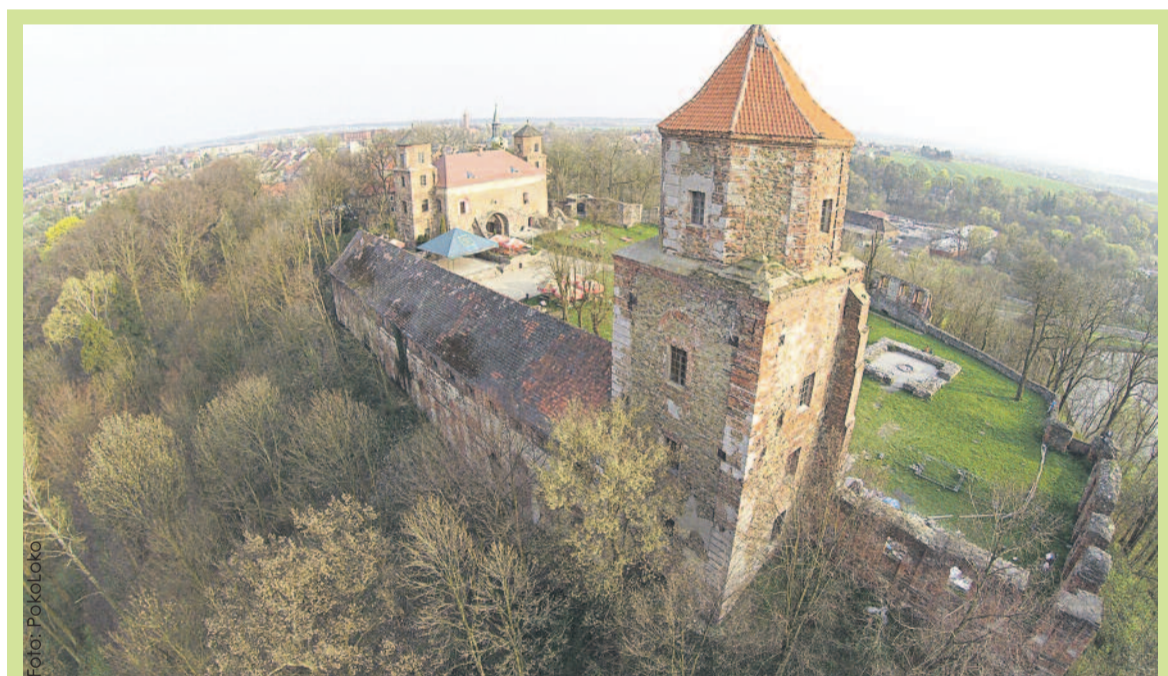
Zamek w Toszku widziany z lotu ptaka.