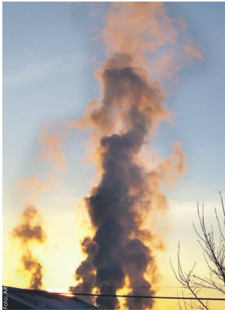
Wydobywające się z komina kłęby czarnego dymu są zabójcze dla naszego zdrowia.