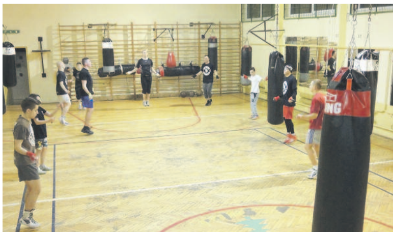
Klub przyciąga zarówno młodszych, jak i starszych zawodników, mężczyzn i kobiety.