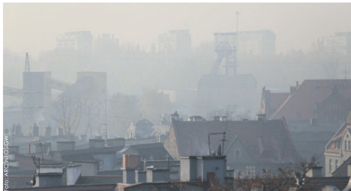
Smog towarzyszy nam tej zimy wyjątkowo często.

czego zakazać palenia mułem i paliwami złej jakości oraz doprowadzić do wymiany starych kotłów na nowe w ciągu najbliższych 10 lat. Apelujemy do rządu o wprowadzenie takich rozwiązań w skali kraju, potrzebne też będą skuteczne kontrole stosowania przepisów w tym zakresie – informuje marszałek województwa śląskiego Wojciech Saługa.