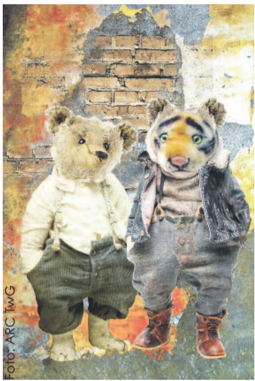
Miś i Tygrysek to postaci z twórczości Janoscha, które zabierają dzieci w podróż do Panamy.

Pierwszą premierą odmienionego gliwickiego teatru – który działa od ub. roku pod zmienioną nazwą, z nowym kierownictwem i w innej konwencji artystycznej – był „Dom spokojnej młodości”. Sztuka weszła na afisz pod koniec stycznia. To żywa, pełna muzyki rockowej opowieść o czasach, gdy w naszym kraju skończyła się epoka PRL-u i wszyscy z radością witaliśmy „nowe”. Pokazuje nieodległe lata, dylematy, z którymi przyszło nam się zmierzyć i stawia pytania, na jakie