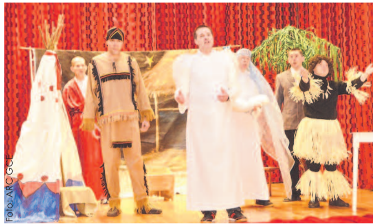
Nagrodzony występ zespołu z DPS-u w Pilchowicach.