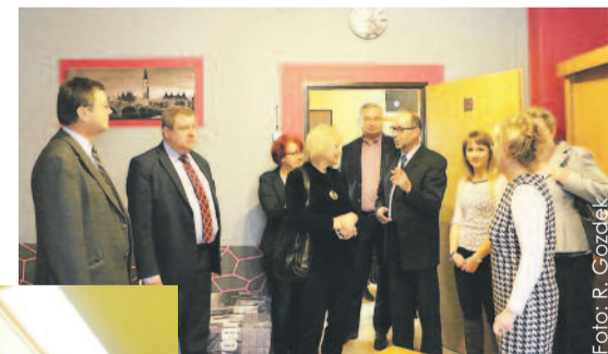
Radni z Komisji Zdrowia mieli okazję zobaczyć efekty ostatnich remontów, przeprowadzonych w DPS-ie „Zameczek”.

cy Komisji Zdrowia. – To bardzo cieszę. Mieszkają tu ludzie pokrzywdze-