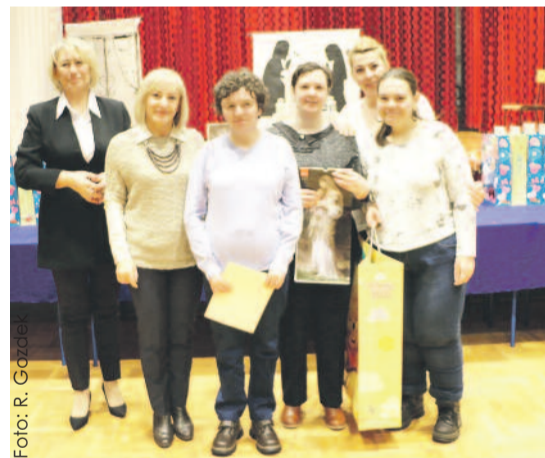
Przedstawicielki grupy teatralnej z „Ostoj” tuż po odebraniu nagród.