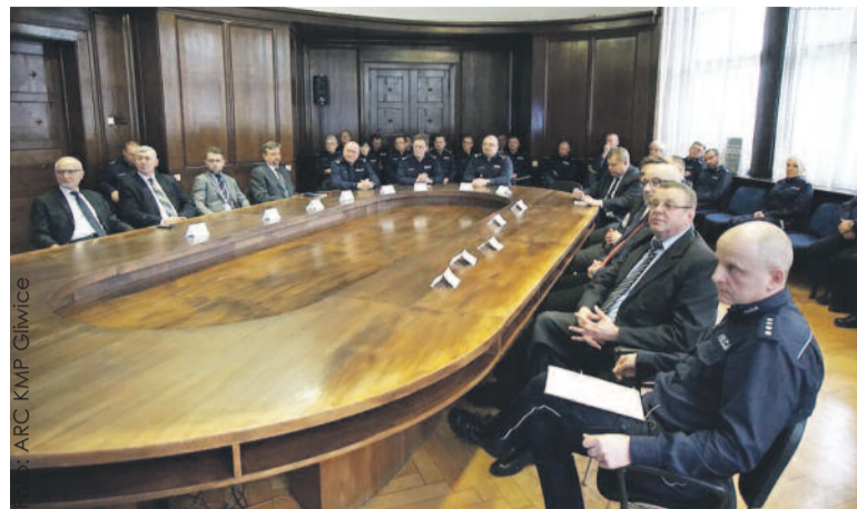
W odprawie rocznej w KMP w Gliwicach uczestniczyli m.in. samorządowcy z powiatu gliwickiego.

KMP w Gliwicach w ub. r. odnotowała spadek liczby przestępstw kryminalnych ogółem, wzrosła też ich wykrywalność. Coraz lepsza jest efek-