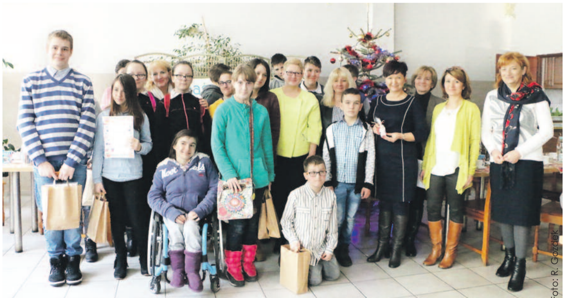
Pamiątkowe zdjęcie uczestników i organizatorów konkursu.