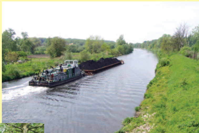
▲ Przez powiat malowniczo wije się Kanał Gliwicki.

W pobliżu wsi Dąbrówka założono rezerwat przyrody „Hubert”, będący ostoją rzadkich gatunków roślin, płazów, gadów i ptaków, a na granicy miasta Gliwice i gminy Sośnicowice powstał drugi rezerwat przyrody „Las Dąbrowa”. Bogactwo zwierzojny sprzyja rozwojowi łowiectwa – w powiecie gliwickim istnieje kilka obwodów łowieckich, a tuż za granicą powiatu funkcjonuje Ośrodek Hodowli Zwierzojny Łownej „Gajdowe”, leżący wprawdzie w powiecie strzeleckim, ale należący do Nadleśnictwa Rudziniec. Zwolenników sportów wodnych i wędkarstwa przyciąga możliwość wypoczynku nad zbiornikami Dzierżno Duże, Dzierżno Małe i Pławniowice, nad których brzegami powstały ośrodki czasowe, pola kempingowe i przystanie żeglarskie. Można tu nie tylko wypożyczyć żaglówkę, ale i po odpowiednim szkoleniu uzyskać