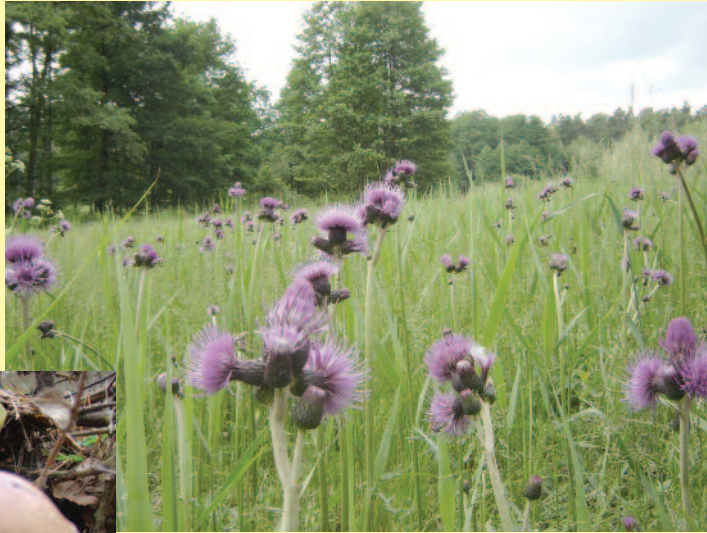
▲ Jest gdzie zanurzyć się w kwiatną łąkę...

w gminach Rudziniec, Sośnicowice i Pilchowice oraz doliny rzek – Bierawki i Kłodnicy, a także łąki i pola zielonych. Amatorzy pieszych i rowerowych wycieczek przemierzać mogą m.in. olbrzymie kompleksy leśne, wśród których przeważają bory sosnowe i lasy liściaste. Występują one zwłaszcza w północnej i zachodniej części powiatu, czyli w gminach: Wielowieś, Toszek, Rudziniec, Pilchowice i Sośnicowice.