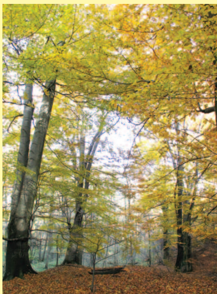
▲ Drzewostan bukowy w Nadleśnictwie Rudzińiec.