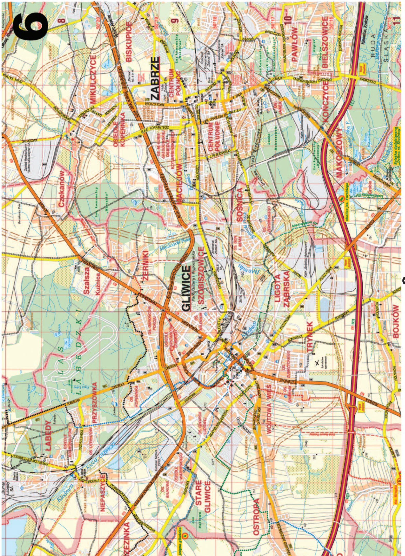
Kolejne części mapy zamieszczać będziemy w następnych wydaniach WPG. Można je wycinać z gazety i potem skleić zgodnie ze schematem obok.

Powstała jeszcze w XIX wieku. Palmiarnia liczy obecnie ponad 6 tys. okazów fauny i flory. Można w niej podziwiać rośliny cytrusowe, przyprawowe oraz egzotyczne palmy i kaktusy, pochodzące z Australii, Afryki i obu Ameryk.