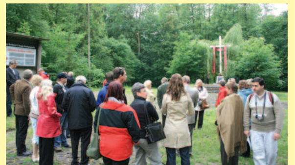
▲ Ogromne wrażenie na zwiedzających powiat wywarła polana Śląski Katyń na obrzeżu Rezerwatu Przyrody „Hubert”.

Dzień drugi uczestnicy spędzili praktycznie, zwiedzając sztandarowe produkty turystyczne naszego powiatu. Odwiedzi m.in. Rezerwat Przyrody „Hubert”, drewniany kościół i Gminny Ośrodek Kultury w Poniszowicach, zamek w Toszku, pałac w Pławniowicach oraz agroturystyczne „Ranczo” w Proboszczowicach.