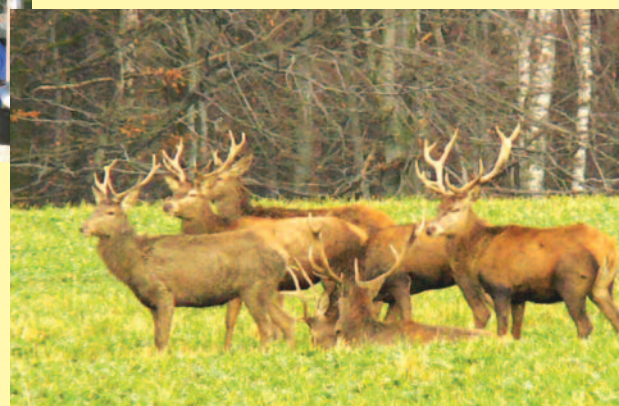
▲ Gratka dla miłośników przyrody: stado dorodnych jeleni.

Pełne atrakcji są także lasy powiatu gliwickiego oraz ukryte w nich rezerваты przyrody i ścieżki edukacyjno – leśne. Wokół zamków powoli tworzy się infrastruktura turystyczna. Wzrasta oferta cyklicznych imprez historycznych, branżowych, okazjonalnych.