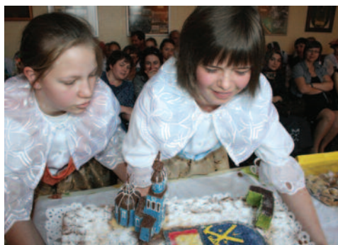
Autorki przepisu ze swym dziełem.

Składniki: na ciasto – 75 dag mąki pszennej, 20 dag masła, 8 jaj, 15 dag cukru, 8 dag drożdży, 1/2 szklanki mleka, szczypta soli, tłuszcz do wysmarowania blachy; na masę makową – 1 kg niebieskiego maku, 50 dag cukru, 1 szklanka mąki pszennej, 25 dag masła, 8 dag migdałów, 8 dag rodzynek, szczypta soli, aromat migdałowy; na posypkę – 40 dag mąki, 20 dag