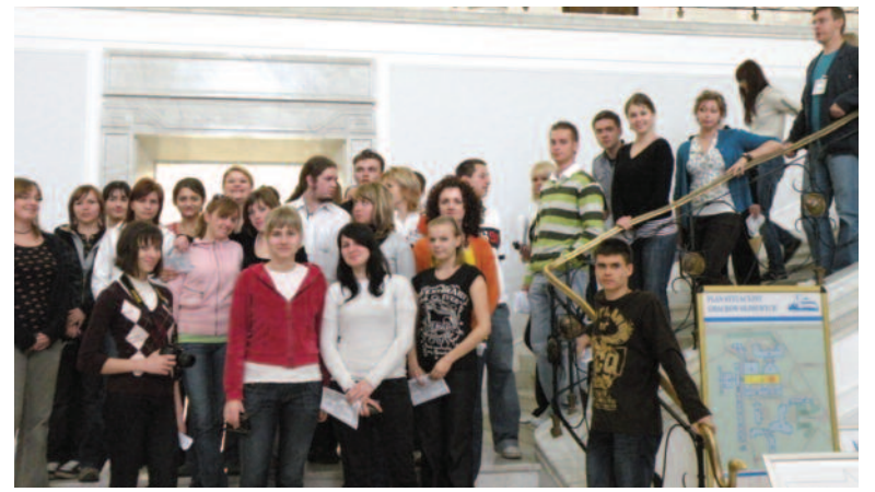
Uczniowie Zespołu Szkół im. I. J. Paderewskiego w Knurowie w budynku Sejmu.

Cenną formą preorientacji zawodowej są wizyty w zakładach pracy, podczas których młodzi ludzie mogą skon-