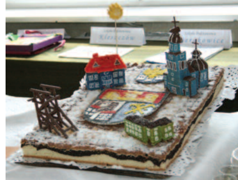
Kołocz był przyozdobiony tak, że tworzył smakowity (w całości jadalny!) krajobraz Knurowa.

krem, dodać wyrośnięty rozczynek i mąkę, wyrobić. Gdy ciasto zacznie odchodzić od ręki i brzegów naczynia, dodać stopiony i wystudzony tłuszcz i dalej wyrabiać do momentu, aż zaczną pojawiać się pęcherzyki powietrza. Wyrobione ciasto pozostawić do wyrośnięcia w ciepłym miejscu, a następnie wyłożyć na wysmarowaną tłuszczem dużą blachę z niskimi brzegami. Po-