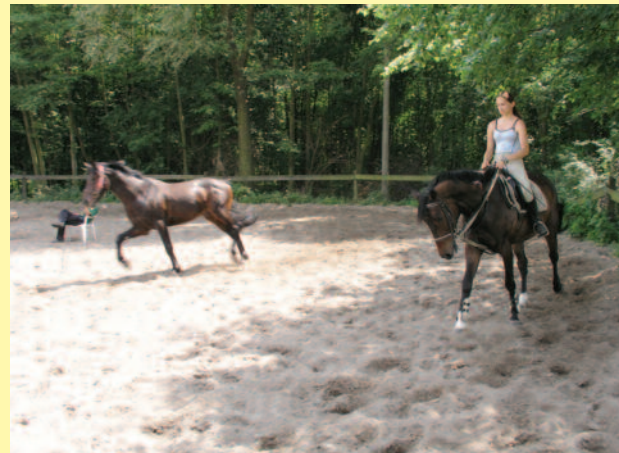
▲ Wciąż przybywa stadnin koni i miejsc do trenowania jeździectwa.