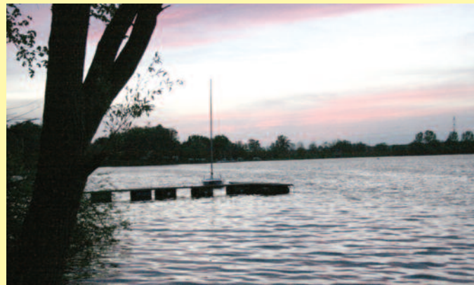
▲ Iście wakacyjny plener...

W powiecie nie brakuje hoteli, ośrodków wypoczynkowych, obiektów rekreacyjnych i gospodarstw agroturystycznych. Zapraszamy w podróż do pięknej, historycznej Ziemi Gliwickiej – zielonych płuc Śląska!