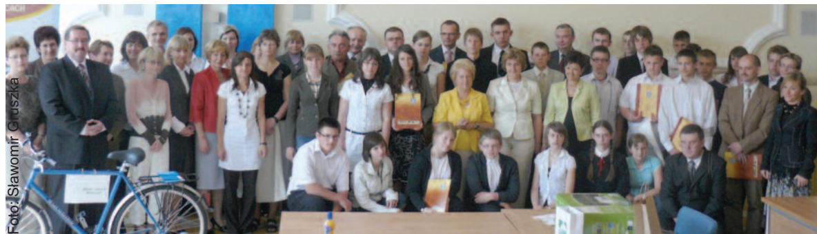
Uczestnicy i organizatorzy konkursu w Sali Sesyjnej Starostwa Powiatowego w Gliwicach.