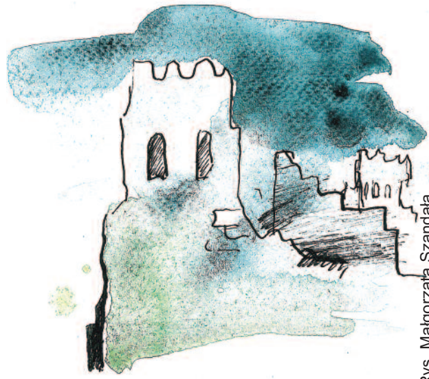
Rys. Małgorzata Szandata

Przez długie lata w tym miejscu, gdzie stał zamek wydobywano piasek, a dzisiaj jest składowisko mułu kopalnianego. (MFR)