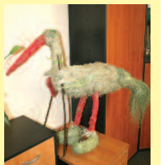
▲ Zwycięski bociek Klekotek.

Dzień drugi uczestnicy spędzili praktycznie, zwiedzając sztandarowe produkty turystyczne naszego powiatu. Odwiedzi m.in. Rezerwat Przyrody „Hubert”, drewniany kościół i Gminny Ośrodek Kultury w Poniszowicach, zamek w Toszku, pałac w Pławniowicach oraz agroturystyczne „Ranczo” w Proboszczowicach.