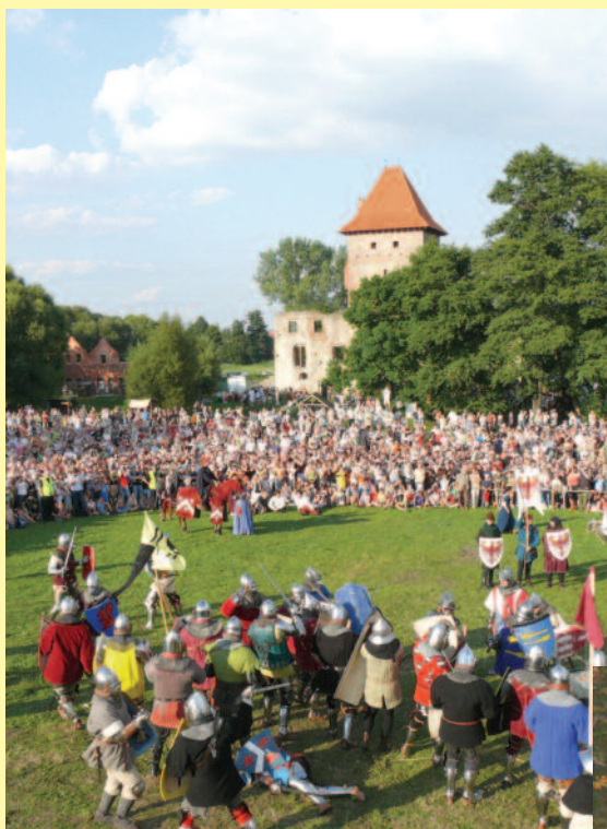
▲ Jarmark średniowieczny w Chudowie – jedna z licznych imprez historycznych, jakie są organizowane przy ruinach tutejszego zamku.

Przykładem zabytku poindustrialnego w powiecie gliwickim jest wieża ciśnienia w Toszku. Bardzo ciekawe są także czynne śluzy na Kanale Gliwickim w Dzierżnie i Rudzińcu. W zajmowanej przez powiat części Wyżyny Śląskiej znaleźć można urozmaicone formy krajobrazu: sięgające 300 m n. p. m. wzniesienia Pagórów Sarnowskich (w gminach Toszek i Wielowieś), pagórkowate tereny