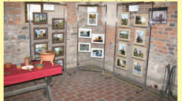
▲ Wystawa zdjęć na zamku w Chudowie – pokłosie konkursu „Cztery pory roku w powiecie gliwickim – atrakcje turystyczne powiatu gliwickiego w obiektywie”.