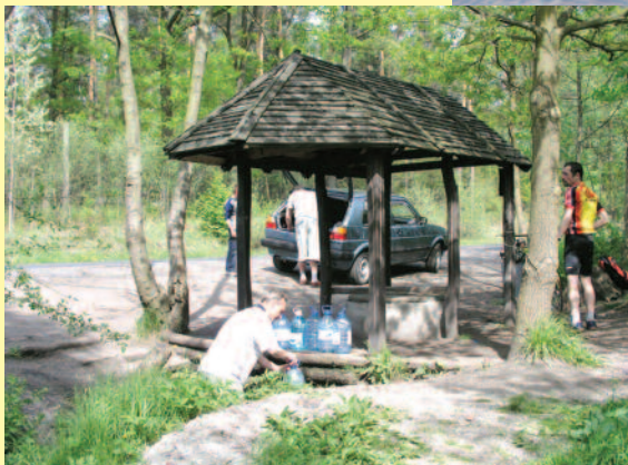
▲ Do cudownego źródła w Stancy jeździ się po wodę.

Najczęściej odwiedzanymi zabytkowymi rezydencjami naszego powiatu są: gotycko – barokowy zamek toszecki, restaurowane z pietyzmem ruiny zamku chudowskiego oraz malowniczy pałac pławniowicki. Nie brak jednak również innych – głównie XIX-wiecznych – pałaców i dworów w kilku miejscowościach powiatu gliwickiego, np. w Pryszowicach czy Wielowsi. Większość z nich oto-