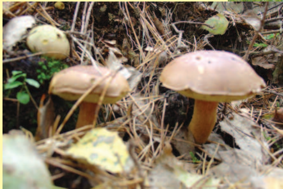
▲ ... albo buszować w poszukiwaniu maślaków.

leżono plejstocenyjskie kości mamuta wielkiego i nosorożca włochatego. Warto przypomnieć, że osadnictwo w regionie powiatu gliwickiego rozpoczęło się w epoce kamiennej i kontynuowane było w okresie rzymskim i wczesnym średniowieczu. O tych zamierzchłych czasach świadczą liczne stanowiska archeologiczne rozsiane po terenie powiatu. Są to zarówno cmentarzyska (Wilkowiczki w gminie Toszek, Świbie w gminie Wielowieś), jak i znaczące się w krajobrazie, w formie wzniesień – pozostałości po wczesnośredniowiecznych i średniowiecznych grodziskach: w Pilchowicach, Żernicy, Chechle, Kleszczowie, Rudnie, Widowie, Kozłowie, Łanach Wielkich, Ciochowicach, Pniowie.