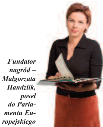
Fundator nagród – Małgorzata Handzlik , poseł do Parlamentu Europejskiego