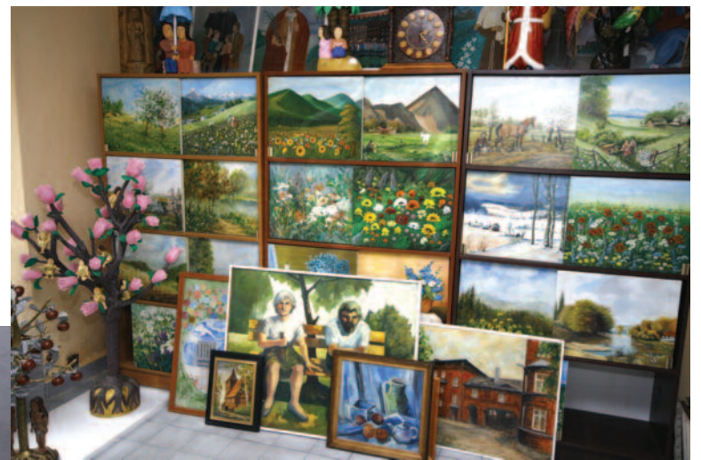
Brakuje miejsca, by należycie wyeksponować wszystkie prace.

ca w Śląskim Parku Przemysłowo-Technologicznym w Rudzie Śląskiej (Szyb Walenty 26). Jeśli zaś chodzi o teren powiatu gliwickiego, to w okresie wiosenno-letnim stowarzyszenie Barwy Śląska planuje zorganizować wystawę oraz plener malarski na Zamku w Chudowie.