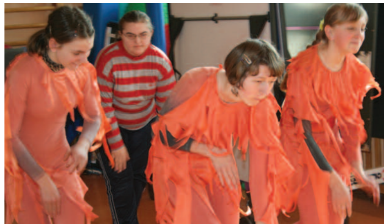
Podczas jednych z zajęć, organizowanych w ramach projektu.

Jednym z zadań projektu jest rozwijanie umiejętności niezbędnych do prawidłowego funkcjonowania w społeczeństwie, przełamwanie barier w komunikacji z otoczeniem a także kształtowanie pozytywnego wizerunku własnej osoby. Te cechy rozwijane są podczas zajęć kółka motywującego, którego głównym celem jest łagodzenie skutków zaburzeń procesów emocjonalno-motywacyjnych poprzez