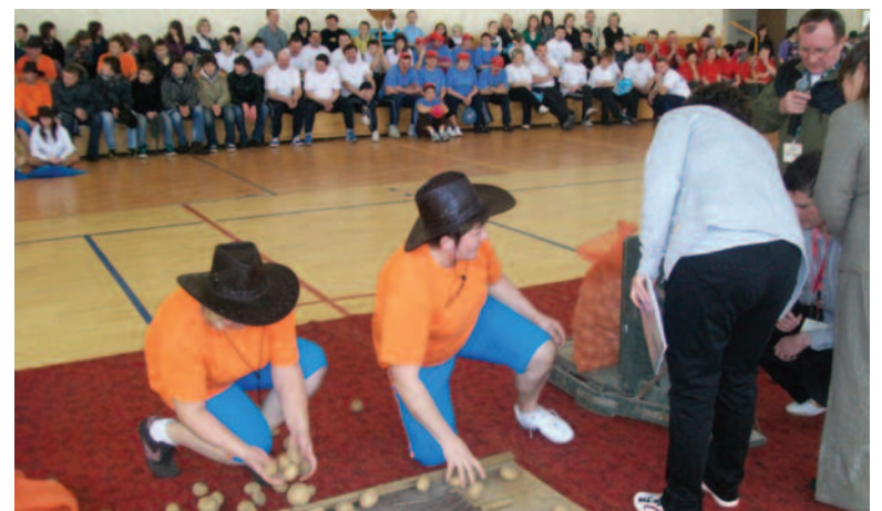
Jedną z konkurencji było ważenie kartofli, ale i przy innych nie zabrakło emocji.