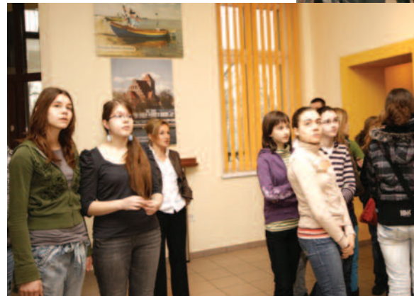
... i w trakcie zwiedzania wystawy, poświęconej powiatom partnerskim Powiatu Gliwickiego.

Na zakończenie każdy z uczestników lekcji otrzymał drobne upominki w postaci materiałów promocyjnych powiatu. Kilku uczniów mogło pochwalić się dodatkowymi nagrodami, które otrzymali wykazując się aktywnością w trakcie spotkania. Nauczyciele zapewnili, że taka lekcja jest najlepszą formą zdobywania przez uczniów wiedzy na temat funkcjonowania samorządu terytorialnego. (SG)