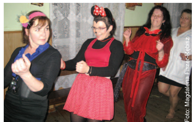
Na zdjęciu uczestniczki babskiego combra w Łubiu koło Pyskowic, które w nocy 15 lutego tańczyły do upadłego, żegnając karnawał.

tsmenki i inne uroczo odziane panie w wieku od lat 15 do 99! Brawo! (MFR)