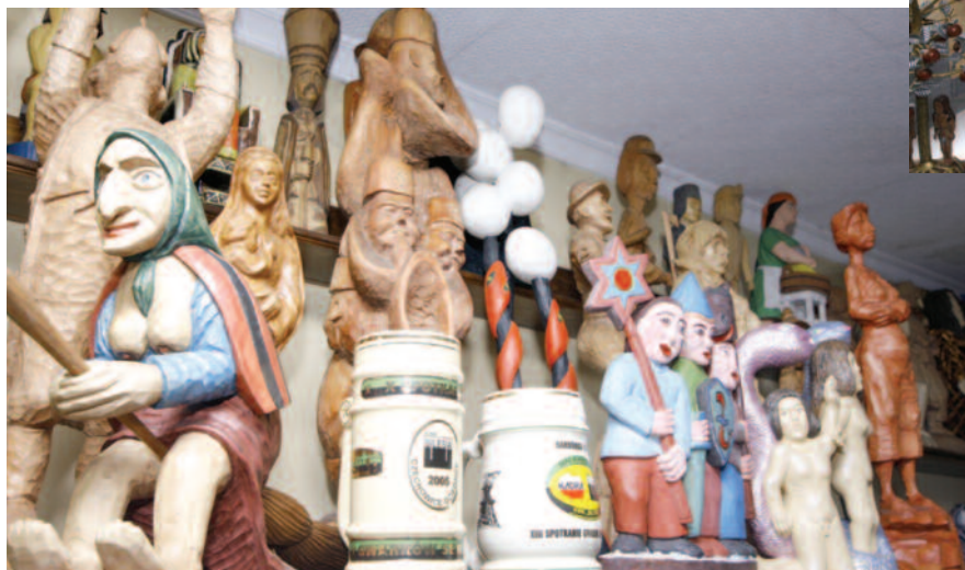
W skład kolekcji wchodzi też rzeźby, m.in. w drewnie.