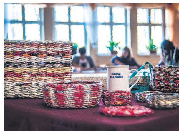
Takie cudne powstały na warsztatach w Poniszowicach.

Trwa projekt pt. „Rozwój talentów artystycznych toszeckich kobiet” z grupy TAAK (Toszecka Akademia Aktywnych Kobiet), wyspecjalizowanych w bibułkarstwie, które poszerzając swoje dotychczasowe kompetencje już przed Dniem Wszystkich Świętych w ub. r. wykonały kompozycje z jedliny i suszonych kwiatów przeznaczone na dekorację grobów. Następnie przygotowały stroiki ozdobne w koszykach i połówkach orzecha kokosowego, ozdabiały wstążkami, pasmami sizalu kapelusze słomiane i gotowe wianki ze słomy, tworząc niepowtarzalne dekoracje domu. Nauczyły się także wykonywać i dekorować wieńce adwentowe z jedliny przy użyciu plastrów suszonych pomarańczy i limonek, wstążek i szyszek. W końcu listopada odbyły kilkuniedniowy kurs plecionkarstwa ze słomy, wykonując piękne kwiaty lili, słonecznika, pałki tataraku i choinkowe aniołki. Takie techniki nie są znane na Śląsku i instruktorka przyjechała na zajęcia z woj. lubelskiego. Więcej na ten temat można znaleźć na stronie www.pkegliwice.pl . Dla poszerzenia wiedzy uczestniczek projektu zostały zorganizowane dwa wyjazdy edukacyjne: do Muzeum Miejskiego w Żywcu i Muzeum Ziemi Cieszyńskiej w Cieszynie. W Żywcu panie poznały m. in. historię bibułkarstwa mocno rozwiniętego w tym rejonie, a w Cieszynie od-