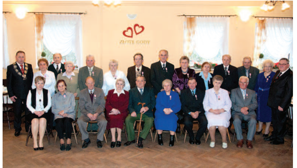
Grono odznaczonych jubilatów wraz z gospodarzami uroczystości.

21 par z terenu gminy Wielowieś obchodziło niedawno uroczyste rocznicę 50 i 60-lecia małżeństwa.