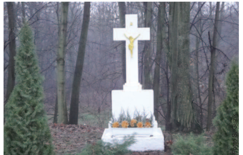
Jeden z przydrożnych krzyży przy wjeździe do Poniszowic.

Nawiązując do konkursu związanego z kościołkami powiatu gliwickiego i pytań z konkursów w „Wiadomościach Powiatu Gliwickiego”, chciałem przedstawić jeszcze jeden szczegół (może mało znany), który dotyczy dziejów Poniszowic. Dramatyczne były dzieje ziem śląskich w czasie wojny trzydziestoletniej 1618-1648. Na terenach przyległych do Poniszowic doszło do krwawej potyczki pomiędzy