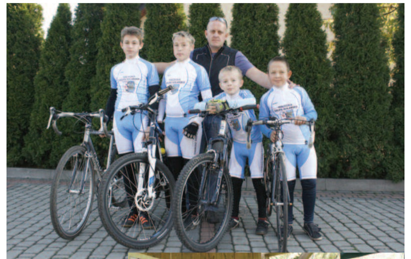
Młodzi zawodnicy Toszeckiej Grupy Kolarskiej i ich trener towarzyszyli nam w październiku ub. r. w otwarciu tras rowerowych powiatu gliwickiego.

go przez Wilkowiczki. Ma 14 kilometrów i jest dobrze oznakowana. Jednak by osiągać sukcesy na zawodach, trzeba prowadzić systematyczny, sumienny trening, wymagający