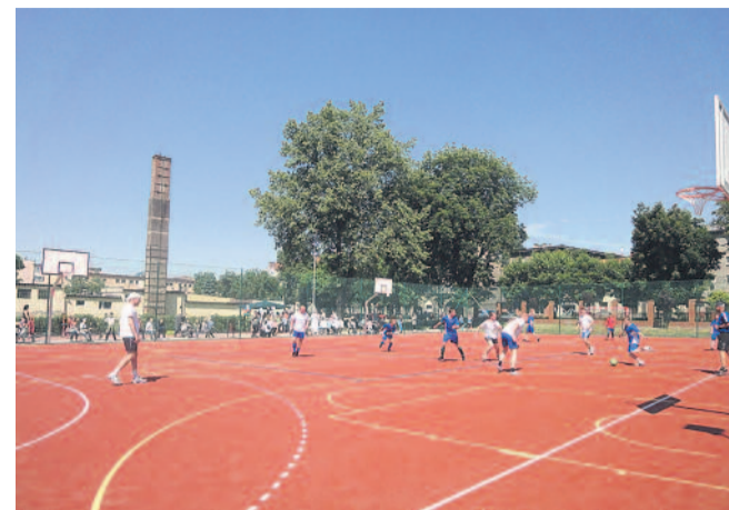
▲ Przy prowadzonym przez powiat Zespole Szkół Specjalnych w Pyskowicach 29 maja oddano do użytku zmodernizowane, wielofunkcyjne boisko szkolne.