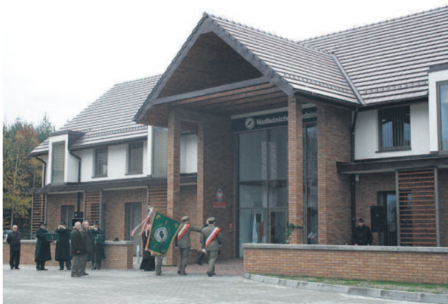
▲ Nadleśnictwo Rudziniec ma nową siedzibę. Z ciasnego budynku leśnicy przenieśli się do nowoczesnego obiektu przy ul. Leśnej 7, uroczystie otwartego 3 listopada.