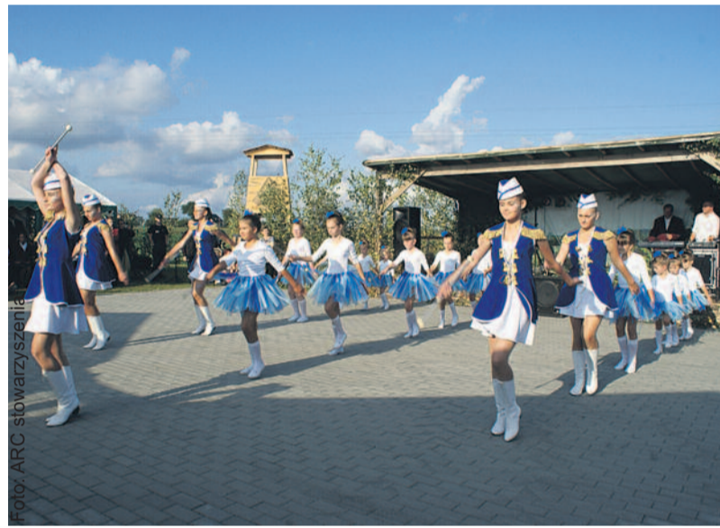
Grupa mażorettek, której występy budzą aplauz publiczności, powstała z inicjatywy kotulińskiego stowarzyszenia.

Kotulin to niewielka wioska leżąca na pograniczu dwóch województw: śląskiego i opolskiego. Pierwsze wzmianki o niej sięgają XIII w. Obecnie liczy ok. 1 200 mieszkańców, wśród nich jest grupa kilkunastu osób, która założyła stowarzyszenie „Razem dla Kotulina”. Oficjalnie działa ono od 16 marca 2012 r., kiedy to zostało zarejestrowane. W jego składzie jest 23 członków, ale chętnych wciąż przybywa. Co ważne, do stowarzyszenia może wstąpić każdy, bez względu na to, czy mieszka w Kotulinie, czy też nie.