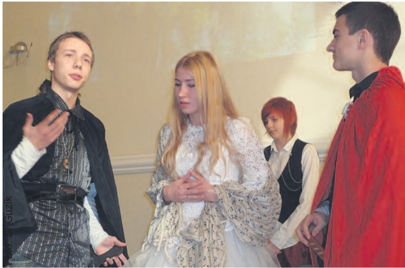
W czasie konferencji uczniowie Zespołu Szkół im. M. Konopnickiej w Pyskowicach zaprezentowali spektakl oparty na romantycznej balladzie.

O przebiegu i efektach realizacji projektu mówili pracownicy Wydziału Rozwoju i Promocji starostwa, szkolni koordynatorzy i sami uczniowie. Przytoczmy tylko najważniejsze fakty. W projekcie – o wartości ponad 1 mln zł – uczestniczyło blisko 700 licealistów oraz uczniów szkół specjalnych z Knurowa i Pyskowic. Od początku 2011 r. do grudnia 2012 r. z jego środków sfinansowano w sumie niemal 7,8 tys. godz. lekcyjnych w ramach 56 różnych typów zajęć edu-