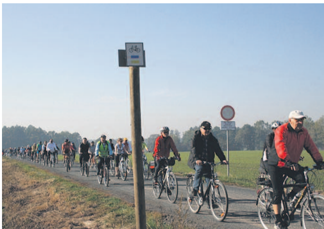
▲ Mamy w powiecie ponad 211 km oznakowanych, w tym 50 km zmodernizowanych tras rowerowych. Otworzyliśmy je oficjalnie 20 października. Unijny projekt, w ramach którego powstały, realizowany był wspólnie przez Powiat Gliwicki i wszystkie 8 gmin z jego terenu.