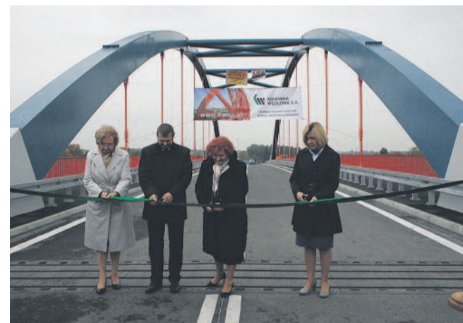
▲ 24 października oddano do użytku nowy most, wybudowany na Kłodnicy w narażonym na powódzie miejscu, gdzie kończy się Zabrze, a zaczynają Przyszowice.