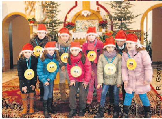
„Śpiewajki” z Pyskowic zrobiły furorę na koncercie w Dąbrowce.