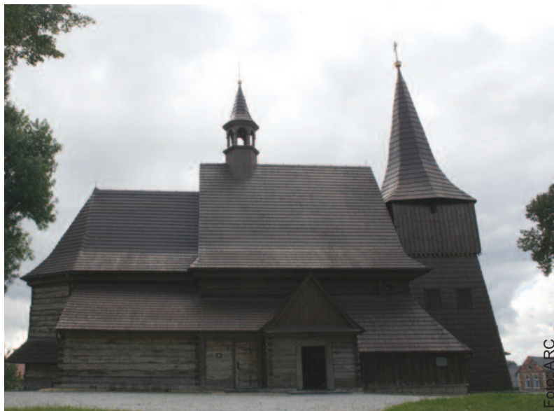
Gdzie mieści się ta drewniana świątynia i jaka jest jej nazwa?

Nad dachem nawy góruje sześcioboczna wieżyczka na sygnaturkę i wycięta z blachy postać Matki Boskiej na półksiężycu. Szczyt dachu prezbiterium zdobi blaszana postać św. Michała Archanioła walczącego ze smokiem. Przypuszcza się, że obie te