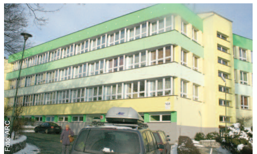
Szpital w Pyskowicach zapewni leczenie tysiącom pacjentów.

Przez lata zasadą było, iż w budżecie powiatu corocznie przeznaczano takie same kwoty zarówno na szpital w Knurowie, jak i w Pyskowicach. Gdy ta pierwsza placówka przekształcona została w spółkę, proporcje te zmieniły się na korzyść szpitala w Pyskowicach. Jednak Powiat Gliwicki – będąc właścicielem nieruchomości zajmowanych przez knurowską placówkę – ma wynikające