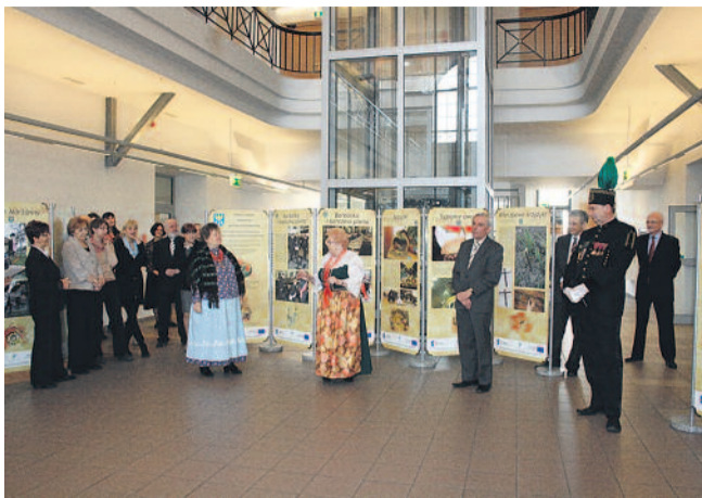
▲ Wystawa „Od wieńca adwentowego do dożynkowego, czyli tradycje, zwyczaje i obrzędy powiatu gliwickiego”, zorganizowana przez Starostwo Powiatowe w Gliwicach w ramach projektu unijnego wędrowała po Śląsku niemal przez cały rok.