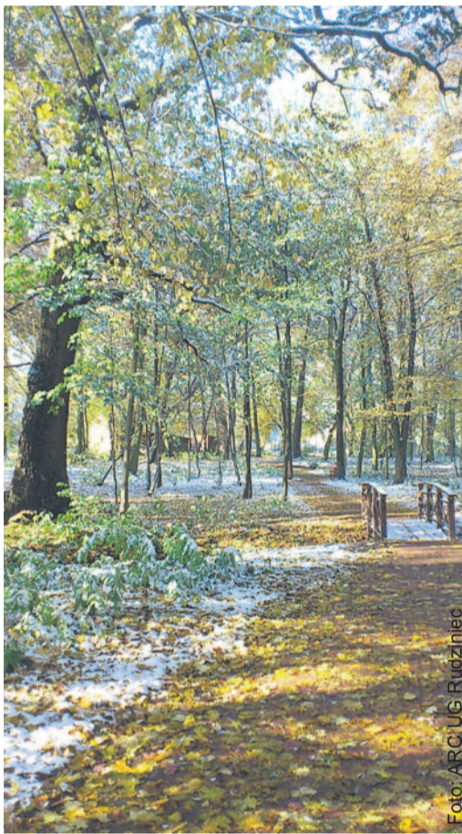
W Poniszowicach wypiękniał zabytkowy park, w którym m.in. zasadzono wiele nowych rododendronów.

Nagrody w wysokości do 1 373,50 zł otrzymały sołectwa: Bojszów (zadanie pn. „Sołectwo Przyjazne Środowisku – Razem polepszymy jakość środowiska naturalnego w sołectwie Bojszów”), Chechło („Sołectwo Przyjazne Środowisku – Zagospodarowanie skwerku w centrum wsi poprzez nasadzenie materiału roślinnego w sołectwie Chechło”), Niekarmia („Sołectwo Przyjazne Środowisku – Utworzenie Zielonej Strefy Kibica na miejscu rekreacji w sołectwie Niekarmia”), Bycina („Sołectwo Przyjazne Środowisku – Budowa ścieżki przyrodniczo-dydaktycznej w miejscowości Bycina – Inwestycja na 750-lecie sołectwa”), Kotliszowice („Urządzenie i utrzymanie terenów zieleni, tworzenie miejsc wypoczynku. Przemysłana i ustalona z mieszkańcami lokalizacja ławek i koszy na odpadki na terenie sołectwa, sadzenie drzewek w miejscach należących do gminy”), Sarnów („Ekologiczne serce Sarnowa”), Proboszczowice („Od klepiska i ścierniska do ochrony środowiska”), Stanica („Kalinowy parking”), Nieborowice („Zielony kort w Nieborowicach”), Pilchowice („Kolorowy skwer”)