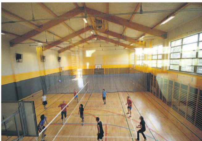
▲ 8 października uroczystie otwarto nową halę sportową przy Zespole Szkół im. I. J. Paderewskiego w Knurowie. Mieści ona boiska do koszykówki, siatkówki, piłki nożnej, tenisa i badmintonu, a na piętrze siłownię i salę fitness.