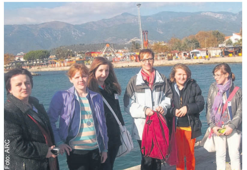
Była okazja, by zwiedzić uroczyste nadmorskie Edremit.