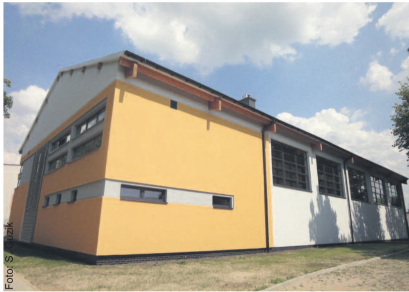
Nowa hala sportowa przy Zespole Szkół im. I. J. Paderewskiego w Knurowie.