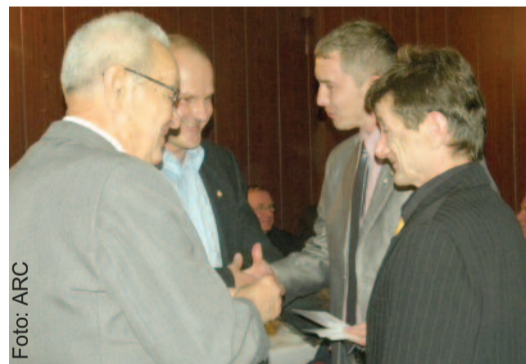
Podczas jubileuszowego spotkania odznaczono i uhonorowano sportowców i działaczy, którzy wnieśli wkład w sukcesy klubu.

Uroczystość zakończyła się zabawą taneczną z udziałem zaproszonych gości, byłych i obecnych zawodników oraz działaczy. (SB)