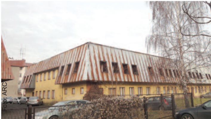
Dużym atutem tego obiektu jest doskonała lokalizacja.

Zainteresowani jej nabyciem mogą uzyskać dodatkowe informacje w Starostwie Powiatowym w Gliwicach, ul. Zygmunta Starego 17, w Wydziale Geodezji i Gospodarki Nieruchomościami pokój nr 010, tel. 32 231 84 01. (JS)