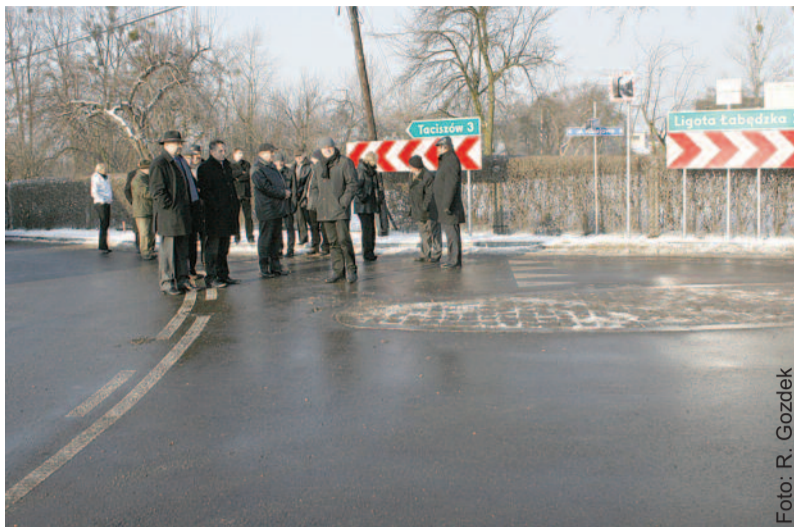
Podczas oficjalnego otwarcia zmodernizowanej drogi.

Investycja wykonana została przez Powiat Gliwicki w ramach zadania „Przebudowa drogi powiatowej Nr 2944S Taciszów-Rzeczycy wraz z budową chodnika przy ul. Wiejskiej w Rzeczycach w Gminie Rudziniec, powiat gliwicki”. Jej łączny koszt to ponad 3,6 mln zł, z czego Skarb Państwa (w ramach Narodowego Programu Przebudowy Dróg Lokalnych) przeznaczył na ten cel blisko 900 tys. zł, Gmina Rudziniec – blisko 1,4 mln zł, a Powiat Gliwicki wraz z Partnerami – blisko 1,4 mln zł. Partnerami przy tym przedsięwzięciu byli: Śląska Grupa Inwestycyjna Sp. z o. o. Katowice, Danish Farming Consultants Sp. z o. o. Rzeczycy oraz Polskie Biogazownie ENERGY-RZECZYCYE – każdy z nich przekazał na ten cel po 150 tys. zł.