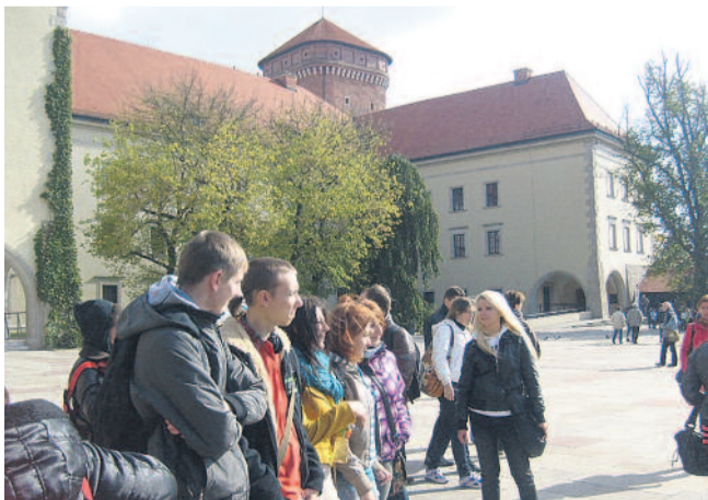
◀ Miniony rok to także czas realizacji projektów unijnych w szkołach prowadzonych przez Powiat Gliwicki. Jedne z nich się zakończyły, inne oferują kolejne atrakcyjne zajęcia dla uczniów. Wycieczki, kółka zainteresowań, kluby dyskusyjne, zajęcia laboratoryjne i plenerowe to tylko niektóre z propozycji w ramach zakończonego w ub. r. projektu „Edukacja dla rozwoju”.