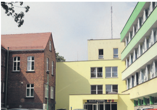
▲ Pomiędzy dwoma budynkami Szpitala Powiatowego w Pyskowicach powstał łącznik komunikacyjny. Inwestycja została wykonana w ramach projektu modernizacji tej placówki. Otwarcie odbyło się 26 lipca.