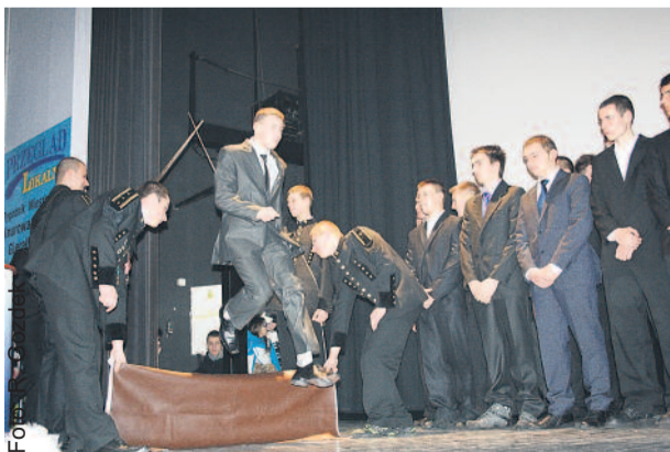
Tradycyjny skok przez skórę, oznaczający symboliczne wejście pierwszoklasistów w szeregi górniczej braci.