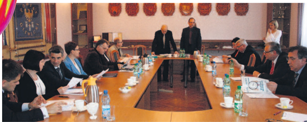
Komisja Zdrowia obradowała wspólnie z Komisją Budżetu i Finansów.