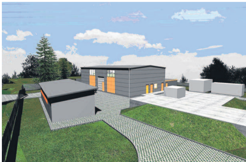
Wizualizacja obiektów nowej stacji uzdatniania wody w Pilchowicach.

Przedsiębiorstwo dostarcza wodę do ponad 3,3 tys. punktów odbioru, za-