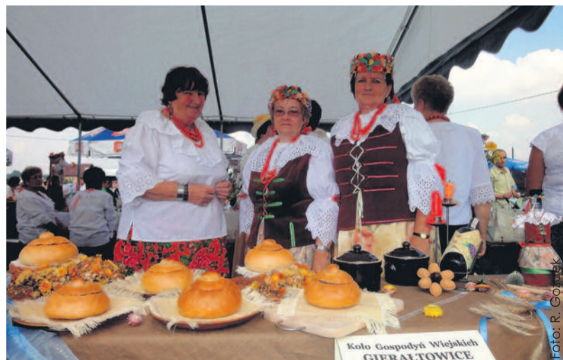
Gierałtowski gospodynie serwują żur w specjalnych chlebkach, dzięki czemu nie tylko pysznie smakuje, ale też pięknie się prezentuje.