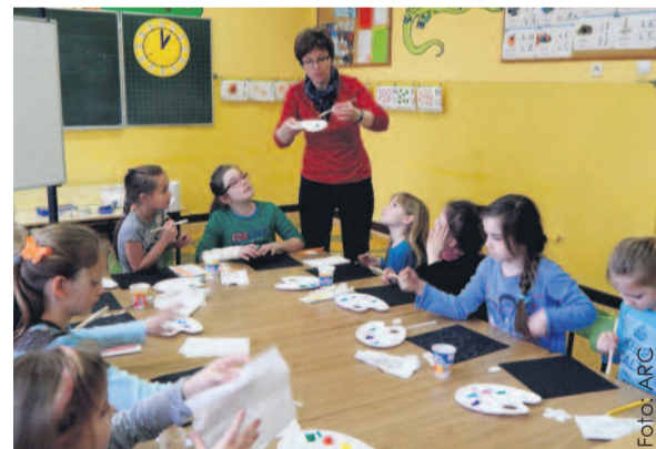
Projekt zapewnia uczniom udział w wielu ciekawych zajęciach.

Jest to już trzeci projekt realizowany w gminie Wielowieś w ramach tego działania. Uczestniczy w nim 114 uczniów z klas I-III z dwóch szkół podstawowych gminy. W ramach projektu re-