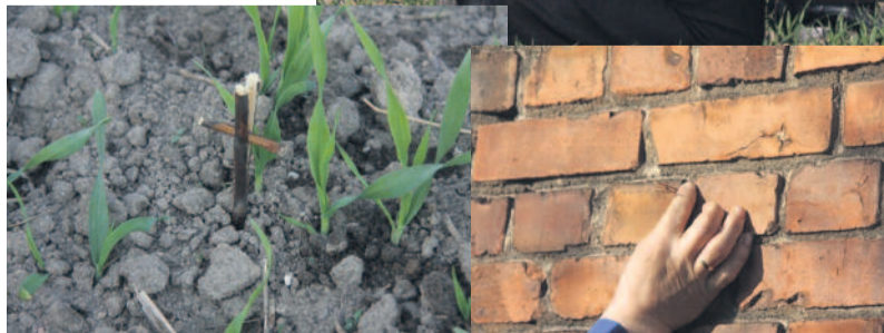
Krzyżyki zrobione z gałązek wierzby gospodarze umieszczają w skibach pola, a także w murach domów, by zapewnić sobie obfite plony, pomyślność i bezpieczeństwo.

ra te krzyżyki, wodę święconą i idą w pole. Po odmówieniu modlitwy błagalnej o urodzaj i dobre plony, poświęceniu pola, krzyżyki wkładają w skiby ziemi w rogach swoich pól lub co dziesięć metrów po obwodzie pola. W niektórych domach wkładają się te małe krzyżyki między cegły w ścianie domu. I ten zwyczaj ma przynieść radość, szczęście i bezpieczeństwo wszystkim domownikom. (MFR)