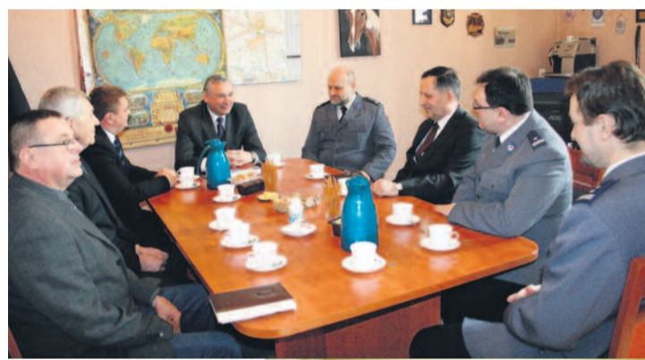
Podczas spotkania w Komisariacie Policji...