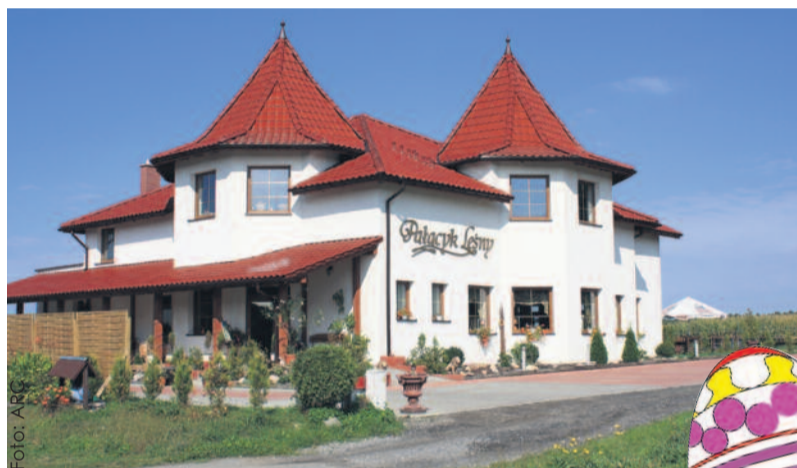
Pałac Leśny położony jest w malowniczym zakątku naszego powiatu.

W Pałacyku stawia się również na regionalność w menu – można tu dostać m.in. tradycyjne śląskie jedzenie. Już teraz w restauracji oprócz rodzinnych uroczystości odbywają się konferencje, można tu także zamówić catering. W przyszłości właścicielka planuje powiększyć ofertę m.in. o organizację imprez plenerowych. (SoG)