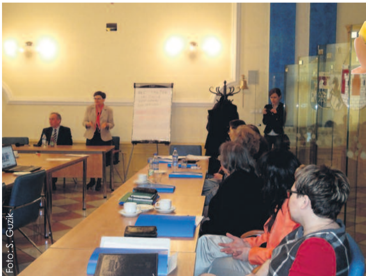
Podczas spotkania w starostwie można było wymienić poglądy z poseł Krystyną Szumilas.

jest nowym rodzajem wsparcia szkoły: – Odpowiada na potrzeby konkretnej placówki i nauczycieli, którzy w niej pracują. To szkoła wybiera, jaki rodzaj oferty jest jej potrzebny. Nowoczesne technologie, zmiany w postrzeganiu świata, oczekiwa-