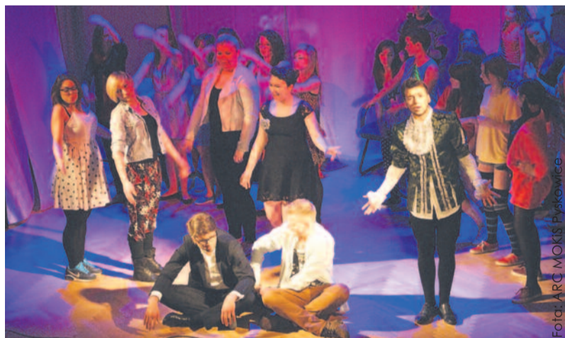
Przedstawienia Carpe Diem niezmiennie od lat zachwycają profesjonalizmem i sceniczną młodością.