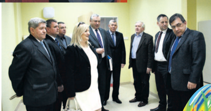
...oraz w Szpitalu w Pyskowicach.