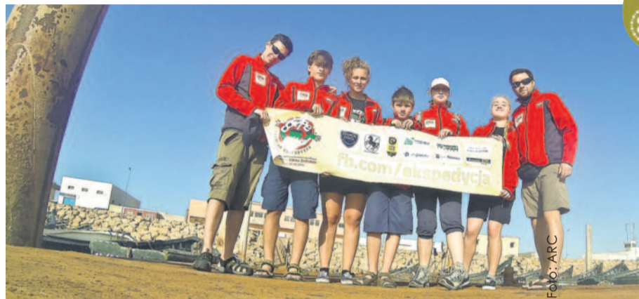
Młodzi podróżnicy w czasie wypraw wszędzie promują swój region i kraj.

„Szkolna Ekspedycja” to projekt edukacyjny, który został zapoczątkowany w Zespole Szkół w Pilchowicach w 2011 r. Jego założeniem jest promowanie wśród młodzieży gminy turystyki backpackingowej – plecakowej, uczącej życia, zaradności i samodzielności. Wszystkie wyprawy są planowane i organizowane przez członków ekspedycji. Jej uczestnicy są nastawieni na poznawa-