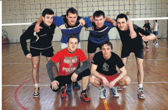
Zwycięska drużyna mistrzostw.

du Gminy Pilchowice. Wsparcia udzieliła również firma Dach Decker z Pilchowic, a także Stowarzyszenie