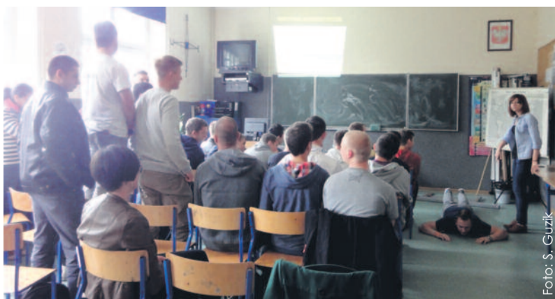
Dużym zainteresowaniem cieszył się panel na temat urazów w sporcie.

Kościarz. W programie imprezy znalazło się wiele wydarzeń. Uczestnicy grali m.in. w badminton, tenis stołowy, siatkówkę. Przygotowano ciekawe panele dyskusyjne. Były one poświęcone m.in. podróżom bez granic, bezpieczeństwu w sytuacjach zagrożenia. Jeden z paneli dotyczył profilaktyki ura-