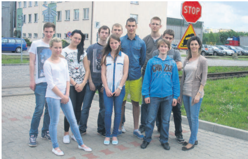
Wizyta studyjna w Śląskim Centrum Logistyki.

W czerwcu uczniowie uczestniczyli w wizytach studyjnych w Śląskim Centrum Logistyki w Gliwicach i w Fabryce Fiat Auto Poland w Tychach. Kolejne wizyty zaplanowane są na październik i listopad br.