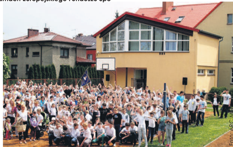
„Biały Dzień” zgromadził na boisku gimnazjum ok. 400 osób – od przedszkolaków, przez uczniów po najstarszych mieszkańców dzielnicy.

Grono pedagogiczne podjęło różne działania. W dzień po kanonizacji naszego patrona, Jana Pawła II, tj. 28 kwietnia tego roku został zorganizowany happening (Biały Dzień), w którym wzięli udział uczniowie naszej szkoły oraz – co najważniejsze – uczniowie zaprzyjaźnionych szkół i przedszkoli,