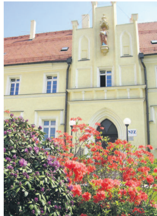
Widoczna do dziś nad wejściem figura św. Józefa umieszczona tam została po rozbudowie szpitala w 1879 r.