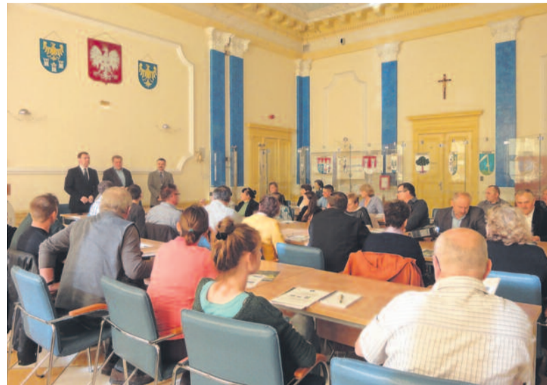
Spotkanie z rolnikami w Starostwie Powiatowym w Gliwicach.

wnosek w ramach systemu jednolitej płatności obszarowej i zadeklarują w tym wniosku zamiar uczestnictwa w systemie lub nie sprzeciwią się automatycznemu włączeniu do systemu,