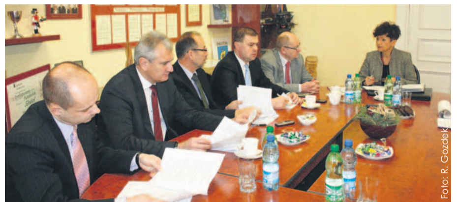
Jedno z ostatnich posiedzeń Doraźnej Komisji Statutowej.