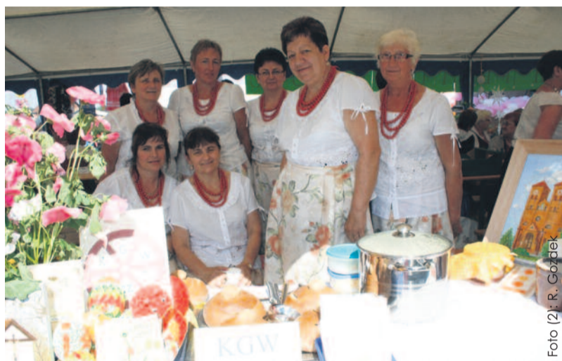
Stoisko gospodyń z Czuchowa było nie tylko smakowite, ale i pięknie przystrójone.