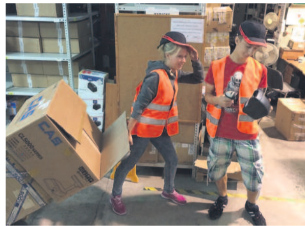
Praktyki w firmie Exorigo – Upos.

Od lutego br. prawie 40 uczestników wzięło udział w praktykach zawodowych w zawodzie technik ekonomista, technik obsługi turystycznej, technik elektryk i elektryk, technik spedytor, technik mechanik, technik górnictwa podziemnego. Nowe doświadczenia