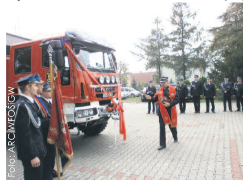
Poświęcenie nowego samochodu ratowniczo-gaśniczego w Rudziniecu.