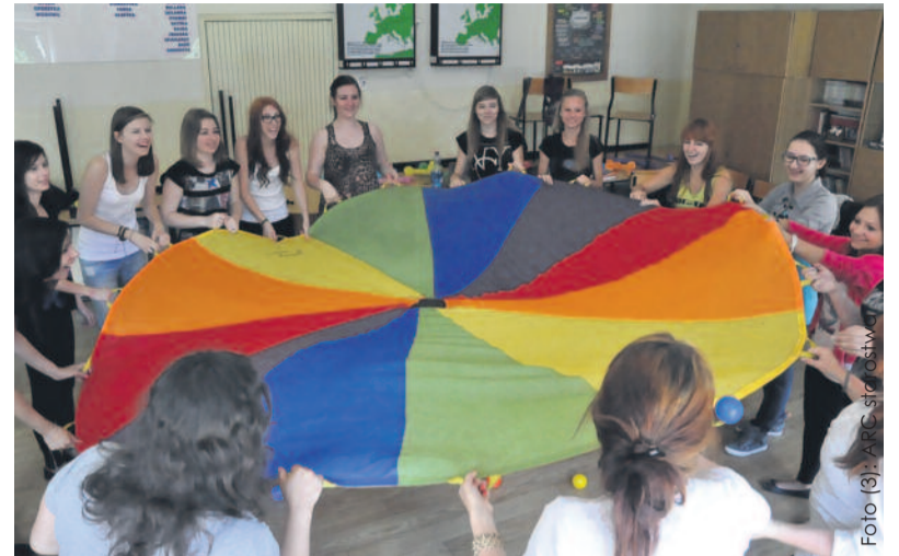
Podczas kursu dla animatorów czasu wolnego.

Uczestnicy projektu otrzymali również dostęp do platformy e-learningowej, która pozwala na uzupełnienie braków wiedzy z poszczególnych przedmiotów, poszerzenie posiadanej wiedzy oraz przygotowanie się do matury. Do tej pory z tej formy wsparcia skorzystało 79 uczniów.