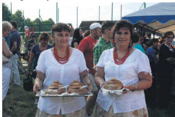
Panie podawały żurek w apetycznych chlebkach.