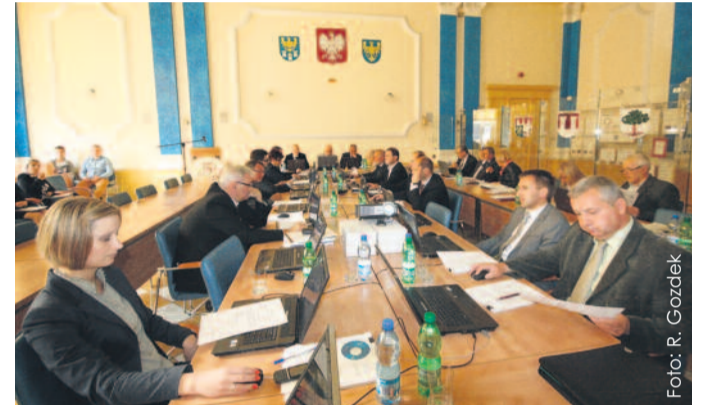
Podczas głosowania jednej z uchwał, które radni podjęli na tej sesji.

Większość uchwał przygotowanych na tę sesję podjęta została przez radnych jednogłośnie. Ze względu na brak quorum nie był głosowany projekt jednej uchwały zgłoszony przez czterech radnych – w sprawie stanowiska Rady Powiatu Gli-