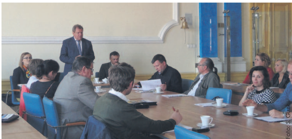
Przedsiębiorcy spotkali się w sali sesyjnej starostwa.

ny ze Śląskiego Centrum Przedsiębiorczości omówiła zarys Regionalnego Programu Operacyjnego Województwa Śląskiego na lata 2014-2020. W projekcie RPO WSL jako osie priorytetowe wymieniono m.in. nowoczesną gospodarkę, cyfrowe Śląskie, konkurencyjność MŚP, efektywność energetyczną, ochronę środowiska, transport, regionalny rynek pracy, rewitalizację oraz