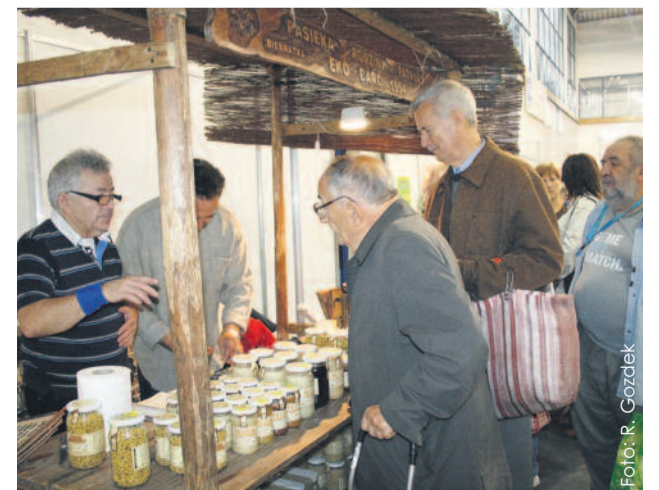
Najbardziej oblegane było od samego rana stoisko z miodami z Puszczy Człuchowskiej.